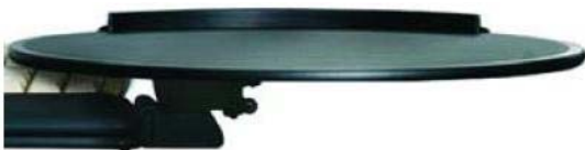
poloha nad klávesnicí