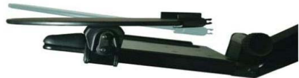
pohled z boku

Nezávislé 30° naklápění uchovává plochu platformy v rovině, i když je klávesnice nakloněna.